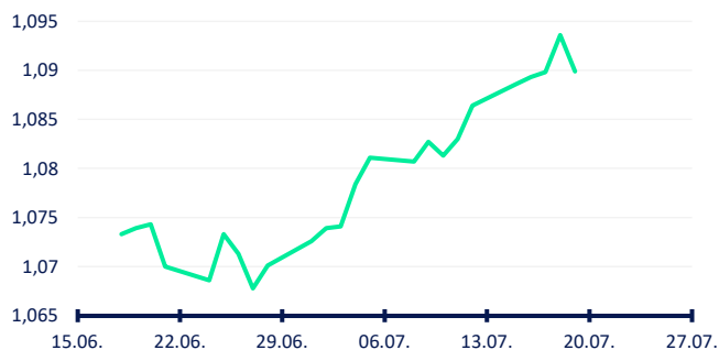
Vývoj za uplynulý měsíc